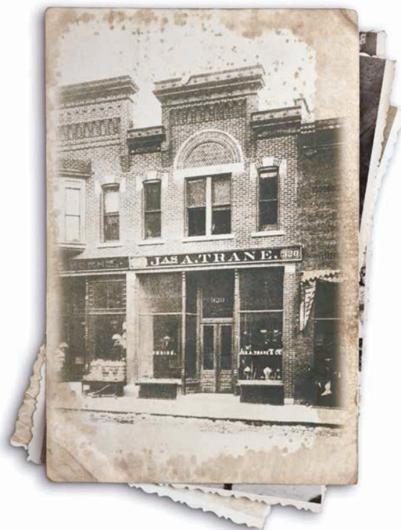
Magasin Trane La Crosse (Wisconsin) 1891

Quand il s'agit de chauffer et de rafraîchir les maisons, les gens considèrent l'équipement Trane comme le plus fiable et le plus durable de l'industrie. Les gens s'attendent à plus d'un leader, et Trane ne les déçoit pas. Chaque fournaise Trane est construite selon nos normes, donc elle dépassera la vôtre. Nous utilisons des matériaux haut de gamme et des conceptions éprouvées qui offrent plus de confort pour moins d'énergie, avec une fiabilité légendaire dans toute l'entreprise. Quand vous faites confiance à Trane, vous faites confiance au leader.